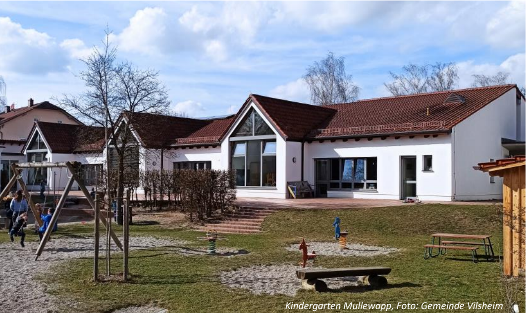
Kindergarten Mullewapp