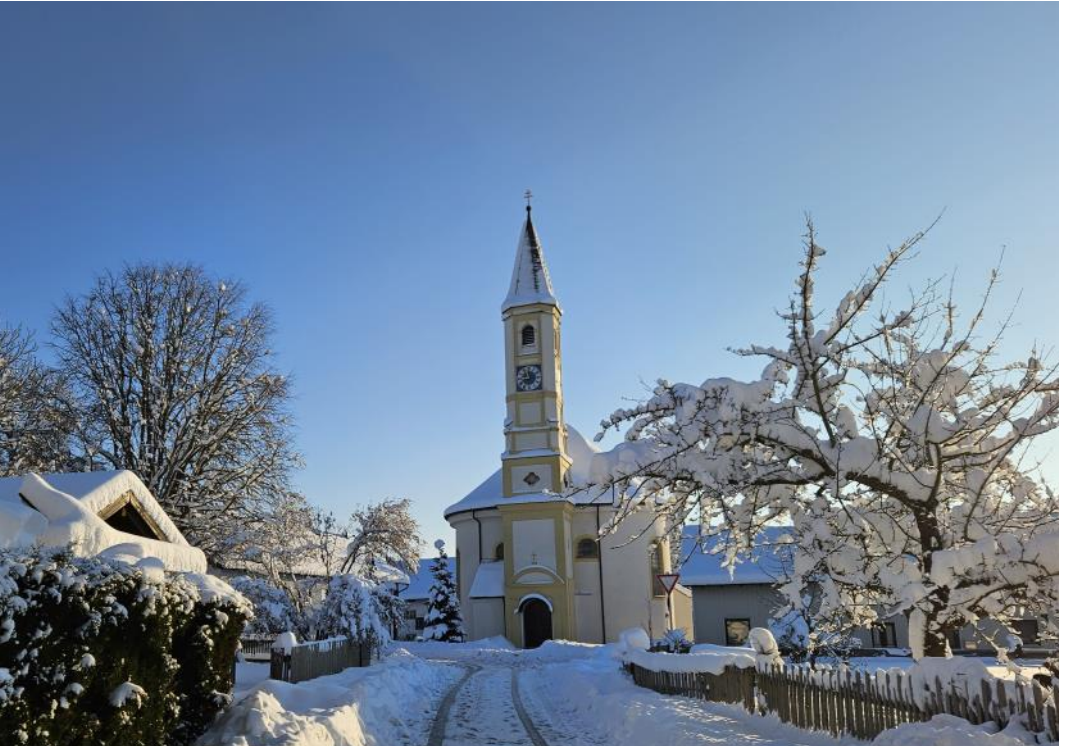
Filialkirche Münchsdorf, Foto: Bianca Wagner