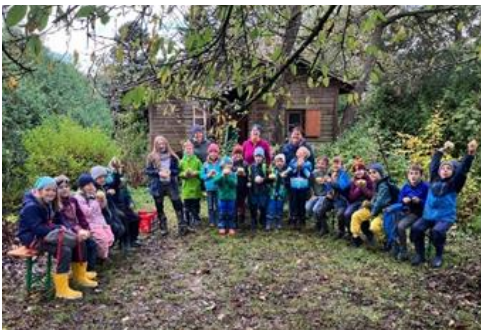
Vilsheimer Naturschützer-Nachwuchs, Foto: BN Vilsh.

Nächstes Jahr feiert die Gruppe ihr 40-jähriges Bestehen am 6. Juli mit einem klassischen Konzert im Schloss Kapfing und am 9. November 2024 mit einem Festabend im Gasthof Stadler. Weitere Infos: bnkleinesvilstal@t-online.de .