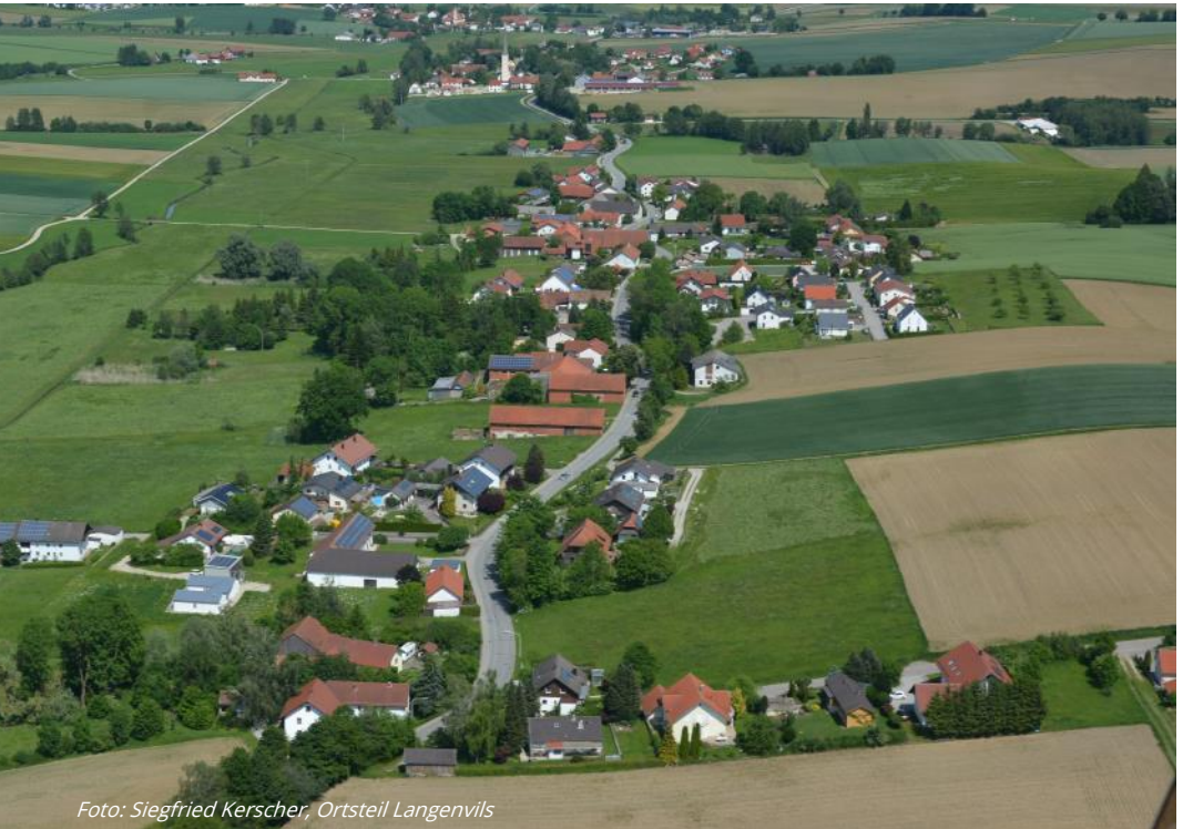
Ortsteil Langenvils